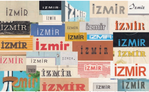
ÜSTTE Çeşitli yayınlardan "İzmir"