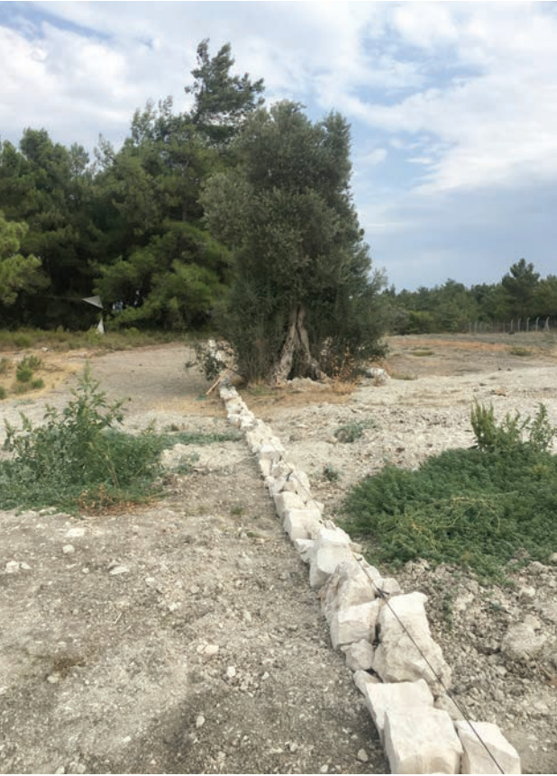
ÜSTTE K2 Urla Nefes Alanı

SAĞDA Soldan sağa sırasıyla; 1 EX-VOTO Kartpostal Serisi: Fırat İtmeç, Ali Ünal 2 Silvavox: Sarp Keskiner, Aykut Beysi, Savaş Çağman 3 K2 Urla Nefes Alanı 4 PORTIZMIR4 Final Sergisi Alanından