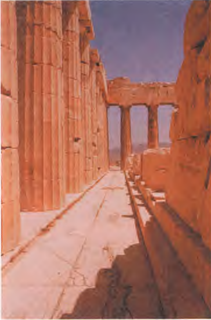
Atina - Akropol - Panthenon

Bu arada gelişen Mimarlık eğitimi Bauhaus gibi yeni açılan eğitim kurumlarında büyük yaklaşım değişikliklerine neden olmuş ve tarihi biçimlerden esinlenmek yerine işlevsel çözümlerin yeğlendiği, akılcı, bilimsel ve deneysel yaklaşımlara dayalı, yepyeni bir mimari estetik geliştirilmiştir.