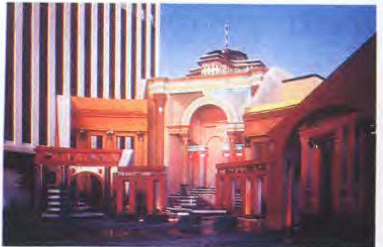
New Orleans; Piazza d'Italia (C. Moore)

kazandırılması konusundaki çabalar sevindirici ise de, bunlardaki bilgilerin okullardaki tasarım stüdyolarına aktarılması, yine de ülkemizdeki mimari tasarımın olumlu bir biçimde etkilenmesine yetmeyecektir. Nitelikli yapılar oluşturma çabamızdaki mimarlarımızın salt okunarak edinilmiş kuramsal ve tanıtıcı bilgi birikimiyle estetik ve mimari değerleri yüksek binalar gerçekleştirmeleri olasılığı oldukça zayıf gözükmektedir. Bu konuda, mimarlık eğitiminde geçen dört-beş yıl süresince, öğrencilerin yazılı kaynak izlemelerinin yanı sıra, eski mimarlık yapıtlarını yerlerinde görüp onları tüm çevreleriyle ve kültürel çerçeveleri içinde izlemeleri gerekmektedir. 19. yüzyılda, Fransa ve İngiltere'de mimarlık öğrencileri için sağlanan Prix de Rome bursları bu gereğin yerine getirilebilmesi için konulmuş ödüllerdir. Günümüzde ise çeşitli yabancı eğitim kurumları arasında varılan anlaşmalar sonucu yapılan karşılıklı eğitim gezileri, yaz okulları ve öğrenci ve araştırmacı değiş tokuşları, yine bu anlamda, hızla globalleşen dünyada yok olmaya yüz tutan kültürel değerlerin saptanması, çalışılıp anlaşılması ve bilgiye dönüştürülmesi açısından önemli bir görev yapmaktadırlar.