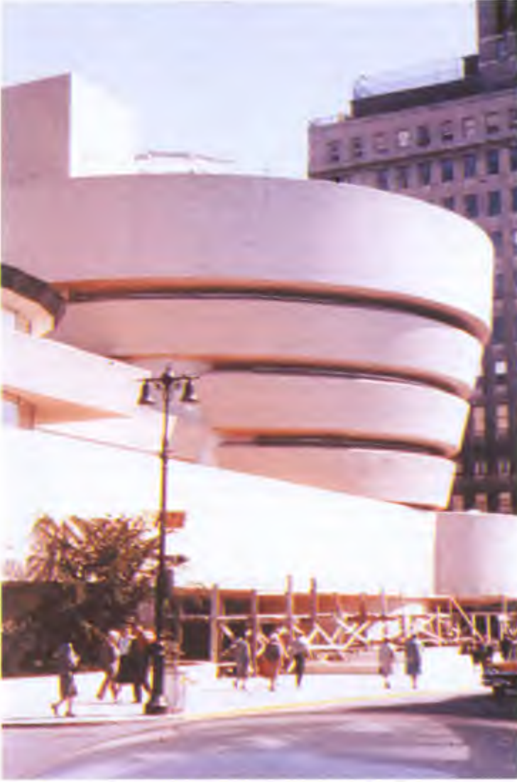
New York; Guggenheim müzesi (F.L. Wright)