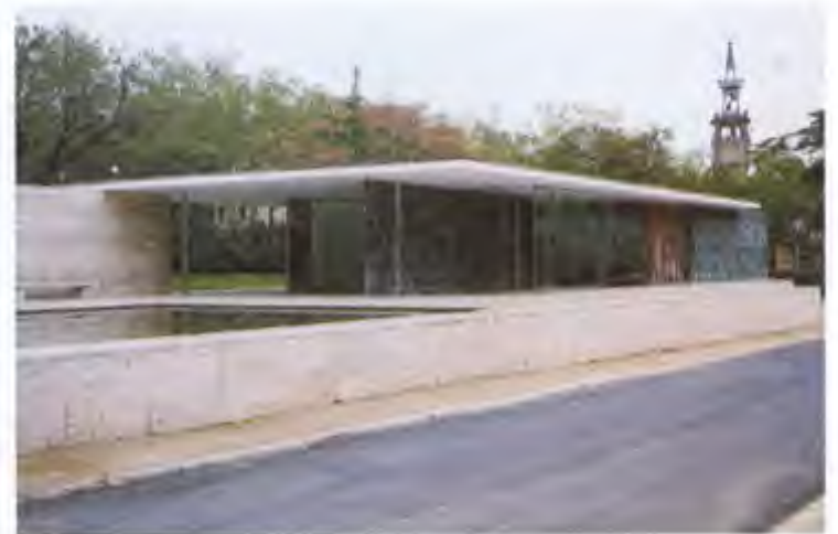
Barselona Pavyonu; (Mies Van Der Rohe)