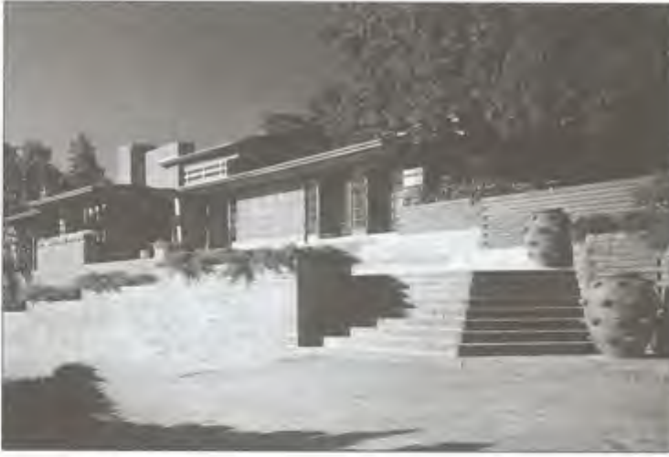
Jean Hanna Evi

Wright, tasarımlarında her zaman süreklilik ve bütünlüğü organik mimaride birleştirmişti. Parçaların bütüne ve bütünün parçalara uyumu olan organik mimari, Wright'ın tasarımlarında insanı, doğayı, malzemeyi, hatta endüstriyi bile içine katmıştır. Daha geniş anlamda, Wright, organik mimariyi şöyle açıklamaktaydı: " Zamana uygunluk, mekana uygunluk, insana uygunluk ". 4 Yaşayan kişi ve yaşanan mekan artık bütünleşerek tek olma özelliğini kazanıyordu.