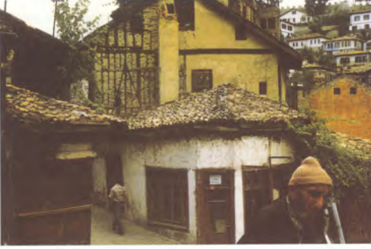
İnsan, Nail Uygur