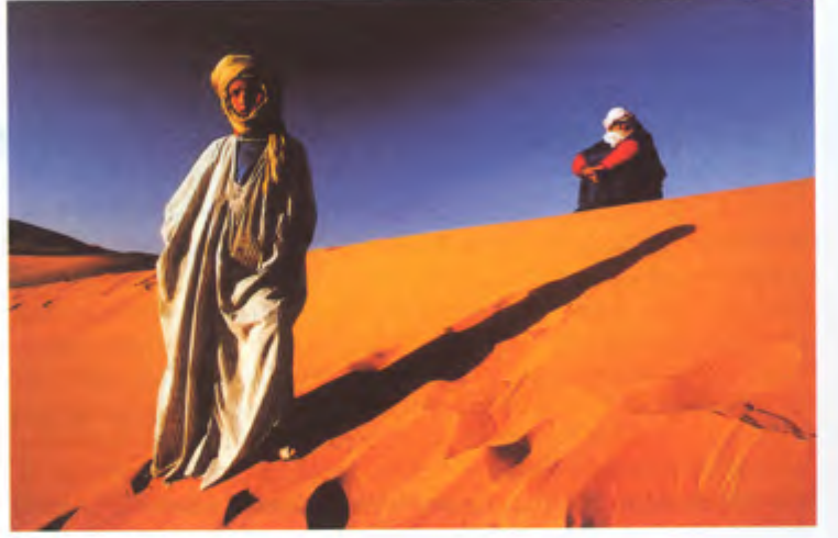
Uzak-Yakın, Yusuf Tuvi