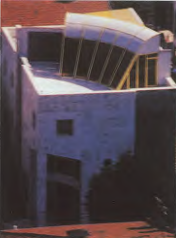
Türsab - İstanbul

Batıda da yapıları kadar sözleriyle de ünlenen bir grubun oluşturduğu bir STAR MİMAR sistemi gelişti. Elbette orada; entelektüel yaşama mimarlar daha çok katkıda bulunuyor, ya da sözlerini biraz daha dinletebiliyorlar. Alıcı olunca söylem de gelişiyor. Star sisteminin profesyonelliğin bir parçası olduğu da bir gerçek... Bir söyleşisinde bir stara (Mario Botta) sorulmuştu, "nasıl tasarlıyorsunuz" diye... Yanıtı: "Beyaz kağıda kurşun kalemle..."