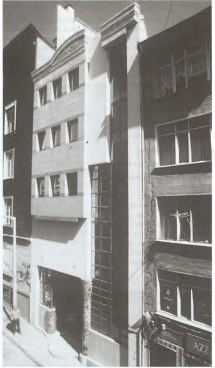
Reklam Evi - İstanbul

"Elbette size iş veriyor diye tüm saatlerinizi ve ruhunuzu satın almış olduğunu düşünen malsahibi; ve onunla bir türlü aynı görüşü paylaşamayan iş ortakları, elemanları, özel ve genel sorunları olan eşi, büronun sevgili genç elemanları, nedense sık sık kasa defteri