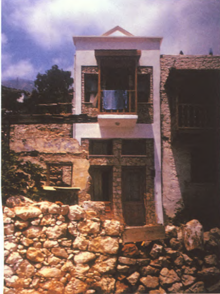
Antalya, Kalkan'da ev