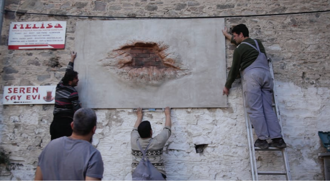
SOLDA, SAĞ ÜSTTE 'Kemeraltı'na Geçici Müdahale" atölye çalışmaları (Resim 7, 8)

Bireyin, iktidarın elinde görünen kendi yaşam çevresini kendinin kılma çabasını De Certeau, "taktik" ve "strateji" kavramları ile açıklamakta (De Certeau 2009, 52), büyük stratejilere karşı, sıradan kent kullanıcısının geliştirdiği taktiklerden söz etmektedir. Taktikler zayıf, dışlanmış olan kent içinde uyguladığı anlık pratikler iken, strateji iktidarın kentsel mekânı düzenleme ve kendinin yapma yolu olarak açıklanır (De Certeau 2009, 110). De Certeau, zayıf olanın taktiklerinin mevcut sistemi yıkıp devirecek nitelikte müdahaleler olmadığını, hâkim düzeni kurcalayarak, bazen onunla oynayarak kendine bu sistem içerisinde yer edinme amacı taşıdığını belirtir.