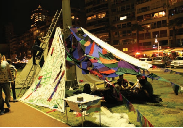
ÜSTTE İzmir Kordon "Gölgelik" çalışması (Resim 1)