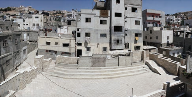
ÜSTTE The Plaza, Al-Fawwar Filistin Mülteci Kampı, Decolonizing Architecture, Campus in Camps, (Kaynak: http://www.campusincamps.ps/projects/02-the-square (Resim 1))