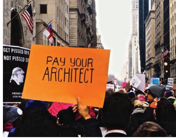
SOLDA Architecture Lobby, (Kaynak: architecture-lobby.org) (Resim 7)